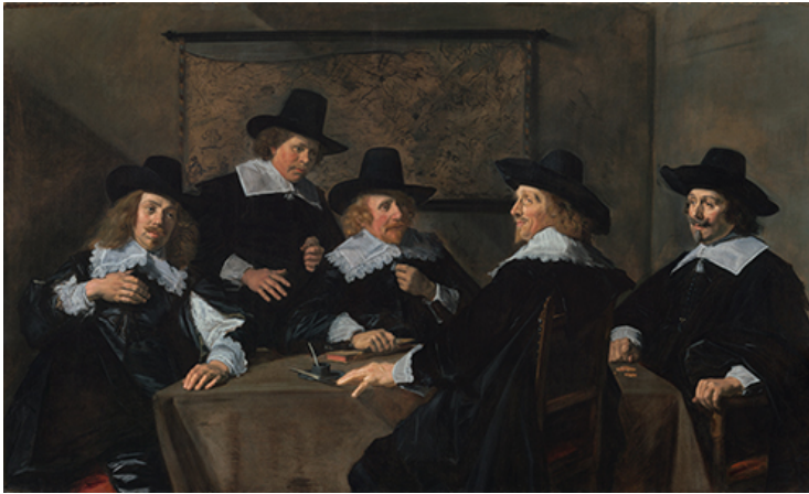
Frans Hals, 'De Regenten van het St. Elisabeth Gasthuis', 1641, Frans Hals Museum, met dank aan Elisabeth van Thüringenfonds

De commissie benadrukt dat het belangrijk is in oenschouw te nemen dat er met betrekking tot de bescherming van het cultuurgoed relevante verschillen (kunnen) bestaan tussen deze soorten eigenaren in het particuliere domein. Cultuurgoederen en verzamelingen in het particulier domein zijn in eigendom van privaatrechtelijke overheidsorganisaties, van commerciële bedrijven (BV's en NV's), van stichtingen met een bredere of meervoudige doelstelling, van stichtingen die louter als doelstelling het houden en beheren van belangwekkend cultuurgoed hebben, van private rechtspersonen die mede met overheidsmiddelen worden gefinancierd en van privéverzamelaars.