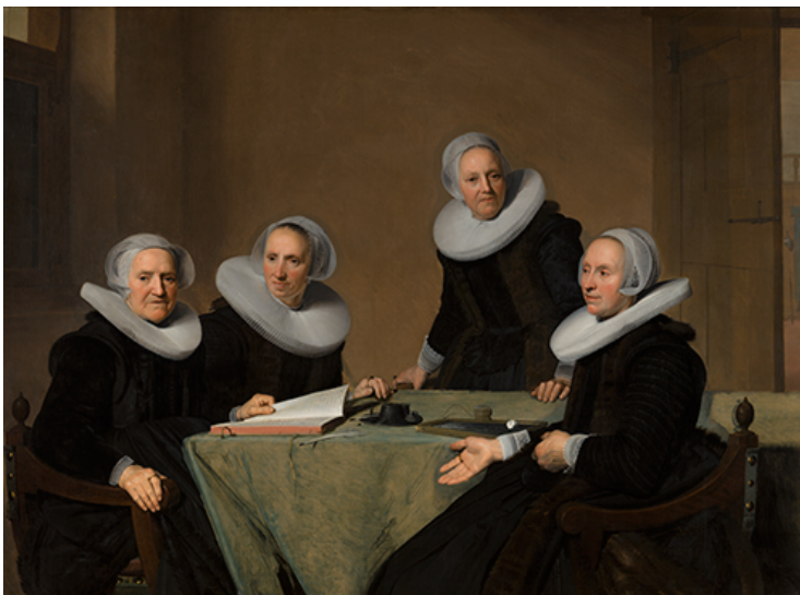
Johannes Verspronck, 'De Regentessen van het St. Elisabeth Gasthuis', 1641, Frans Hals Museum, met dank aan Elisabeth van Thüringenfonds