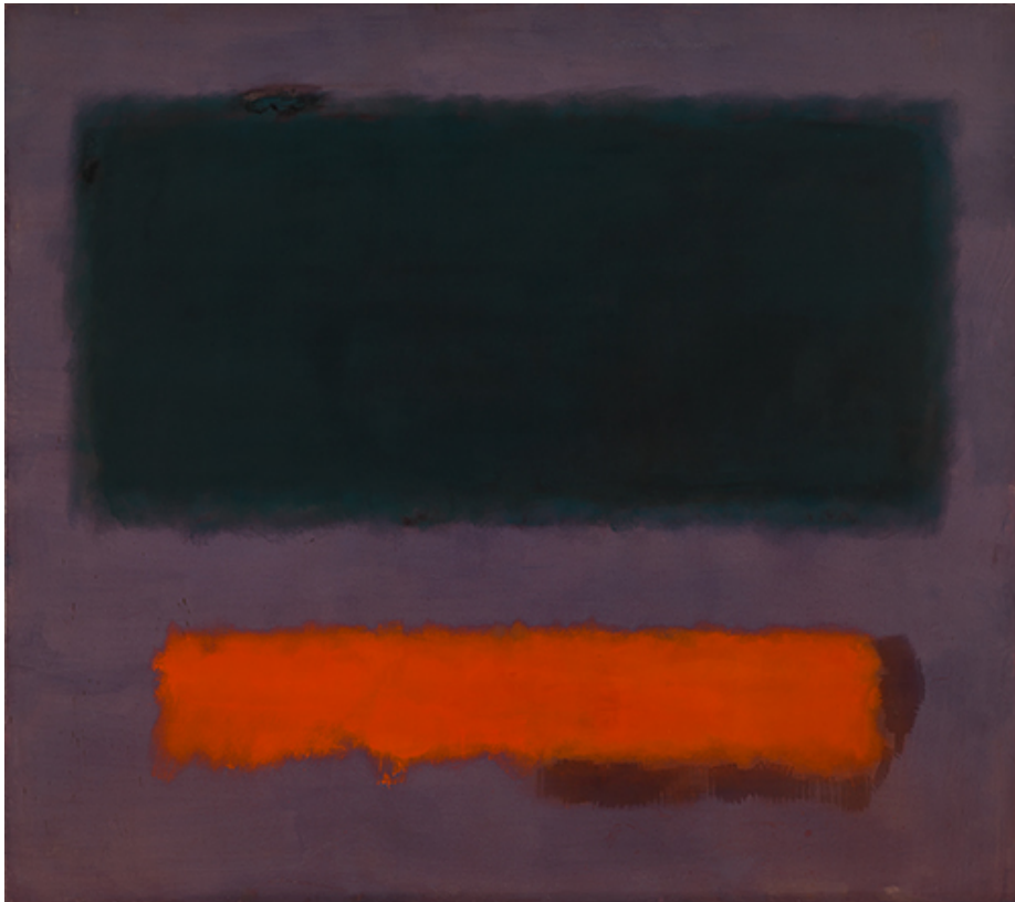
Mark Rothko, 'Grey, Orange on Maroon, No. 8', 1960, Museum Boijmans van Beuningen, Rotterdam.