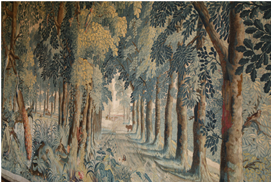
Maximiliaan van der Gucht, wandtapijten, 1642, Bartholomeus Gasthuis, Utrecht (dossiernummer register 43, aangewezen in 1985)

Om de adviesvraag van de minister te beantwoorden, heeft de commissie allereerst de regelingen uit de Erfgoedwet bestudeerd en bekeken hoe deze worden geïnterpreteerd en geïmplementeerd. Daarvoor heeft zij gebruikgemaakt van de Erfgoedwet zelf en van andere juridische bronnen: de parlementaire behandeling, de historische context van de Erfgoedwet en de jurisprudentie. Zij heeft een juridische analyse gemaakt van de Erfgoedwet en de bijbehorende (beleids)regels.