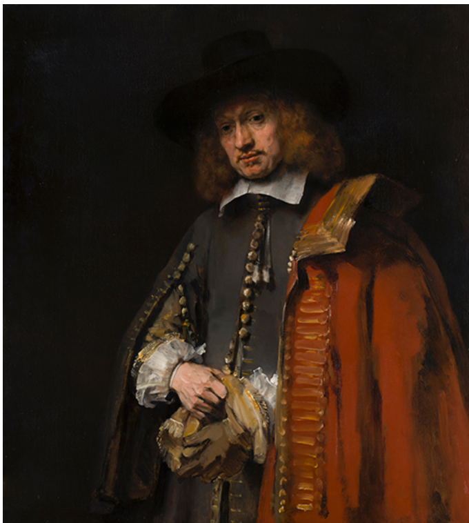
Rembrandt van Rijn, 'Portret van Jan Six', 1654, Collectie Six, Amsterdam (dossiernummerregister 16, aangewezen in 1985)

Met haar aanbevelingen pleit de commissie voor een beleid waaruit meer visie, ambitie, maatschappelijk bewustzijn en gevoel van urgentie spreekt dan uit het huidige beleid. De commissie ziet dit als wezenlijke voorwaarden voor een actieve, effectieve bescherming van belangwekkend cultuurgoed. De commissie spreekt hiermee zowel de overheid en de minister aan, als de vele andere betrokkenen bij de uitvoering van de Erfgoedwet.