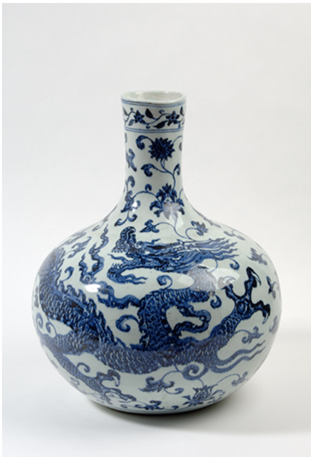
Vaas met decor van drie-tenige draak, China, 1403 – 1424, Keramiekmuseum Prinsessehof, Leeuwarden, bruikleen Ottema-Kingma Stichting

De aanwijzing van een belangwekkend cultuurgoed of verzameling biedt de meest verstrekkende bescherming. Uitvoer van een aangewezen cultuurgoed of verzameling buiten Nederland zonder de vereiste toestemming van de minister van OCW is in dat geval strafbaar en biedt tevens grond voor een internationale vordering tot teruggave aan Nederland.