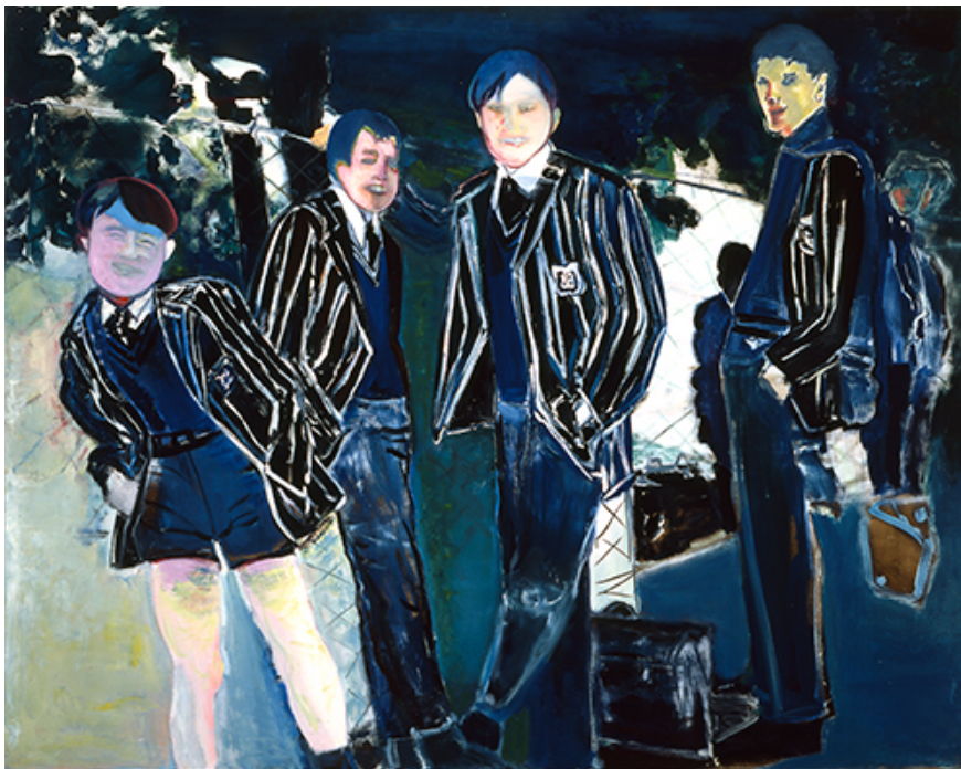
Marlene Dumas, 'The Schoolboys', 1986 – 1987, Copyright werk en courtesy image Marlene Dumas (foto: Peter Cox)

Hieronder worden deze aanbevelingen nader toegelicht.